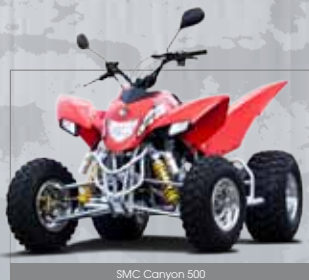
SMC Canyon 500