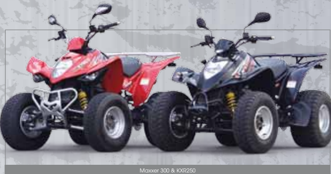
Maxxer 300 & KXR250